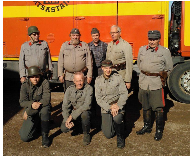
Perinnejaoksen miehet kesällä 2013

Syyskokous pidetään Porin prikaatissa Huovirinteellä. Aika ei ole vielä tiedossa mutta on loka-marraskuun vaihteessa. Jos lähtijöitä on, järjestetään kimppakyyti. Seuratkaa ilmoituksia!