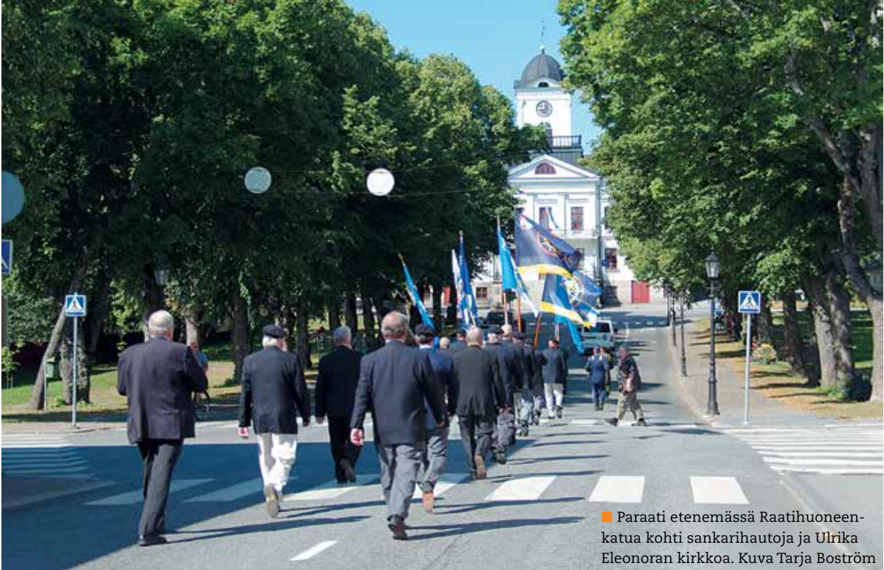
■ Paraati etenemässä Raatihuoneenkatua kohti sankarihautoja ja Ulrika Eleonoran kirkkoa.