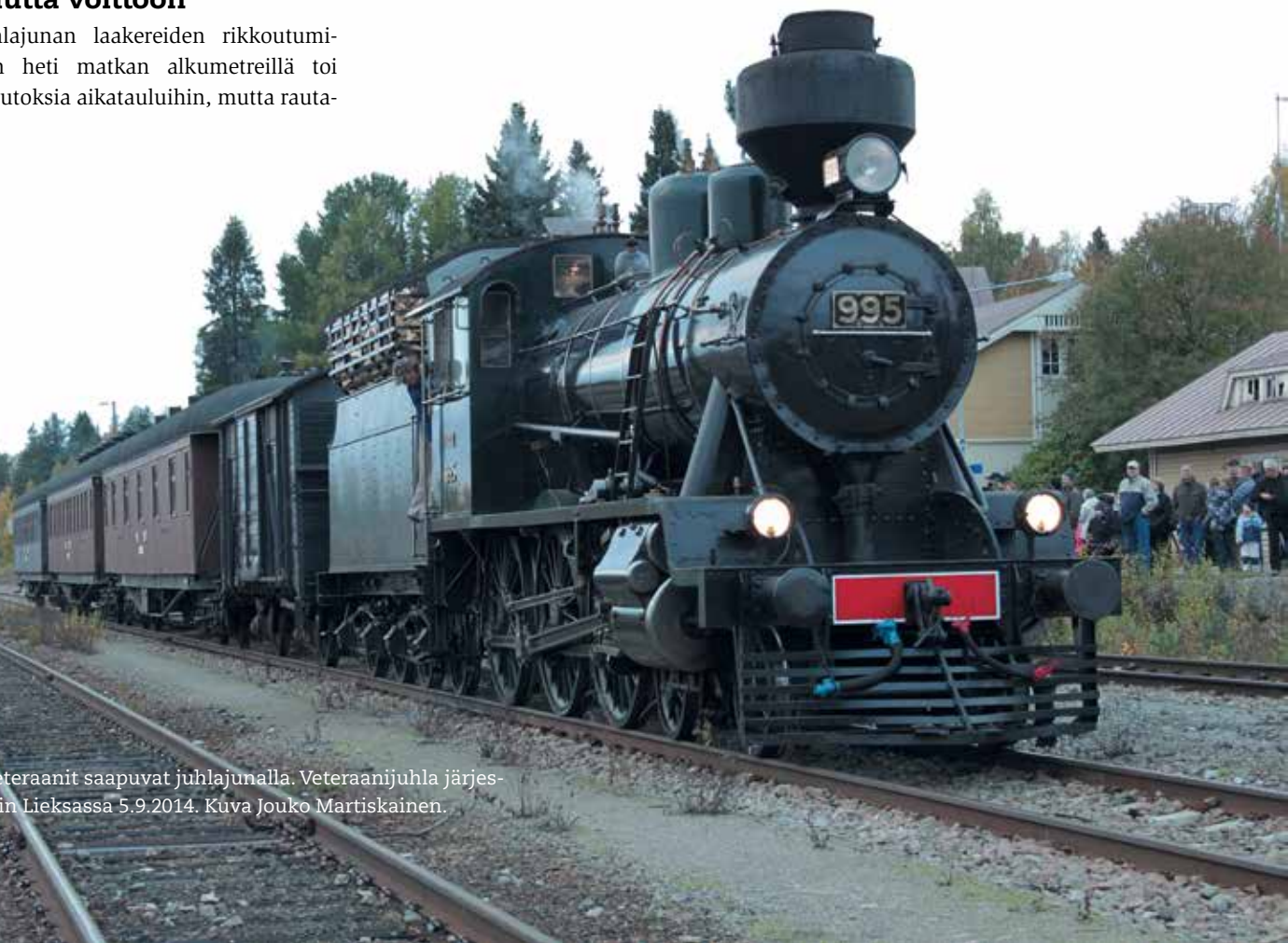
■ Veteraanit saapuvat juhlanjunalla. Veteraanijuhla järjestettiin Lieksassa 5.9.2014. Kuva Jouko Martiskainen.

Lieksan asema pullisteli ihmisiä, kun juhlanjuna vihdoin saapui laiturille. Väkeä oli niin paljon, etteivät autotkaan mahtuneet asema-aukiolle. Useiden arvioiden mukaan vastaanottajia oli liki 600. Kun junassa oli matkajia lähes 400, niin asemalla oli lähes 1 000 henkilöä.