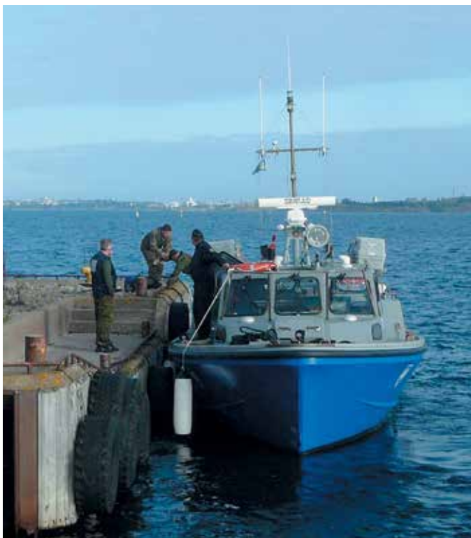
■ Sähköttä-kurssi saapuu M/S Kuivasaarella