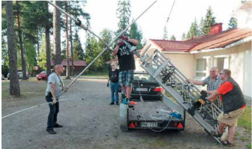
■ Viestimiespäivien radioamatööriaseman OI4PM antennimaston pystytys käynnissä.

Jo vuonna 1968 ehdotettiin viestimiespäivien järjestämistä eri puolilla maata sijaitsevien killan paikallisosastojen toimesta. Ajatus toteutui asteittain ja siirryttäessä liitto-organisaatioon vuonna 1989, alkoi vuorottelu järjestelyvastuun osalta toteutua säännöllisesti. Sen jälkeen viestimiespäiviä, kiltapäiviä tai kesäpäiviä on vietetty mm. Keuruulla, Utissa, Lohtajalla ja jopa Ahvenanmaan Brändössä.