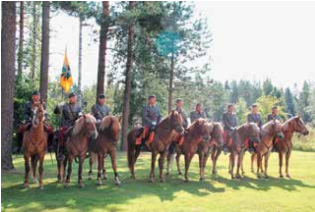
■ Erillisosasto Ilomantsissa. Ilomantsissa laitettiin 1944 viimeinen sulku puna-armeijalle. Taisteluissa kunnostautui Ratsuväkiprikaati. Ratsumieskilta ja Puolustusvoimat vaalivat yhdessä taistelujen muistoa.