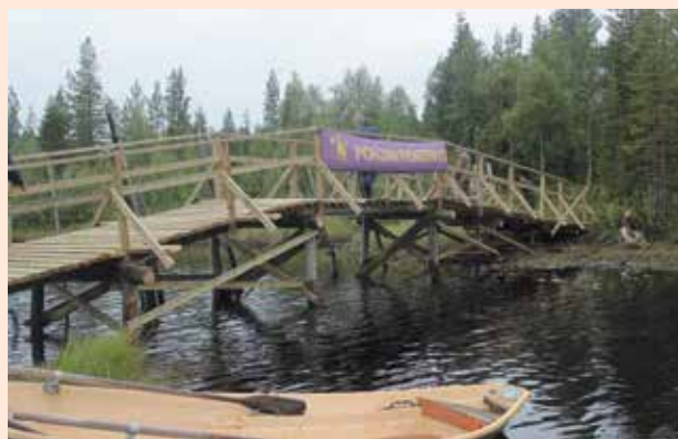
■ Kuusamon Angerjärven puusilta valmiina Kainuun Rajavartioston ja paikallisten asukkaiden käyttöön