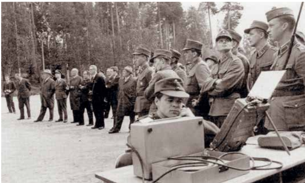
■ Ensimmäiset viestimiespäivät Riihimäellä 1964. Osallistujia rakennus 18 kentällä.

Viestimiespäivät olivat jälleen osoitus siitä, miten samaan aselajiin eri tavoin kytkeytyvät toimijat voidaan koota vapaaehtoisen maanpuolustuksen ääreen ponnistelemaan yhteisten tavoitteiden saavuttamiseksi. Ensi vuonna tavataan!