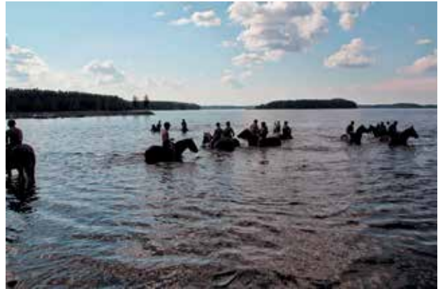
■ Offensiivin aikana vallinnut helle vaikutti hevosten kuljetusjärjestelyihin ja asetti ratsukoiden huollolle erityisiä tarpeita. Kuvassa järjestäytyessä Saimaan Merihevosrikaati uittaa ja juottoa varten.

ominaisuuksien lisäksi hyvää peruskoulutusta ja tottumusta toimia joukon osana. Samoja asioita vaadimme ratsastajilta. Näin saadaan aikaan ratsukoita jotka ratsastavat uusiin voittoihin ratsuväen reippaassa ja railakkaassa hengessä.