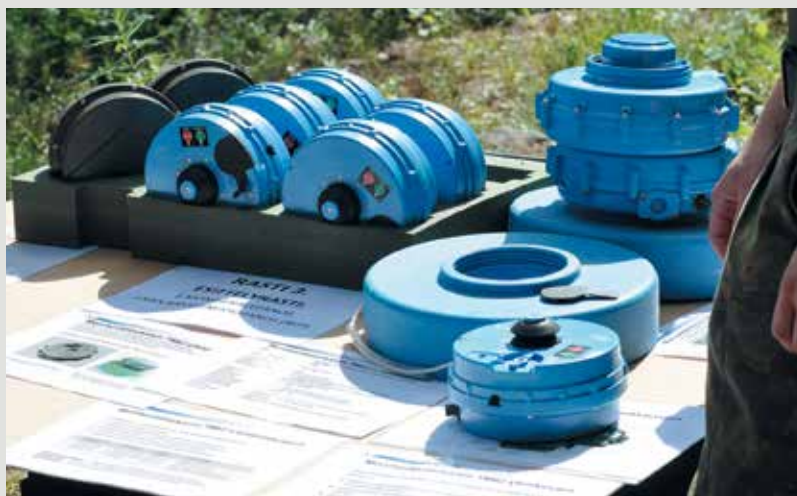
■ Moniherätepanoksen esittely ja koulutusrasti Pioneerij- ja suojelujotoksella (fikka Ellilä)