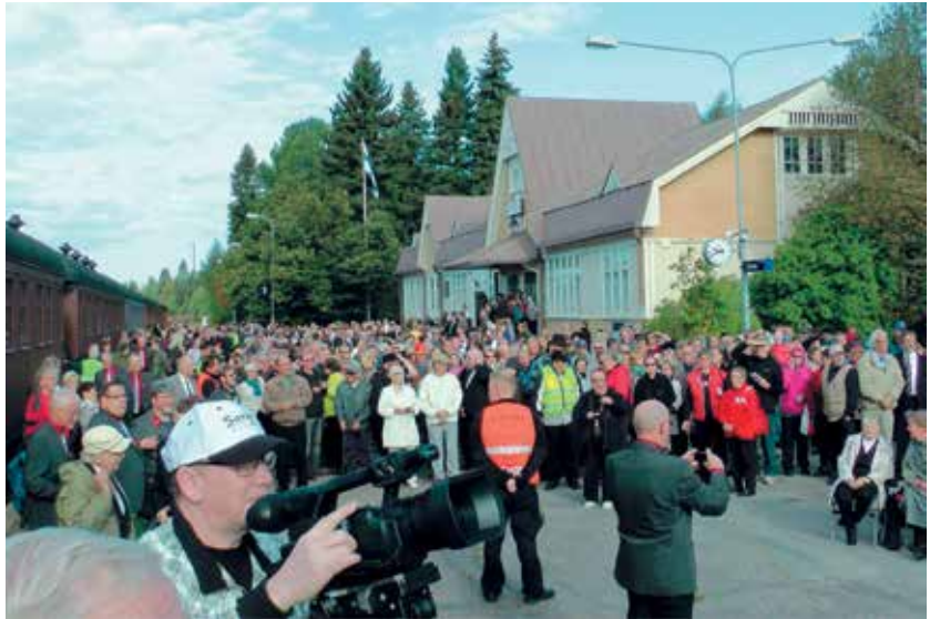
■ Lieksan asemalle oli kokoontunut useita satoja ihmisiä ottamaan vastaan Kiuruvedeltä saapuvaa juhlahunaa.

Juhlaohjelmistoon kuului mielenkiintoisia luentoja, joita oli seura-