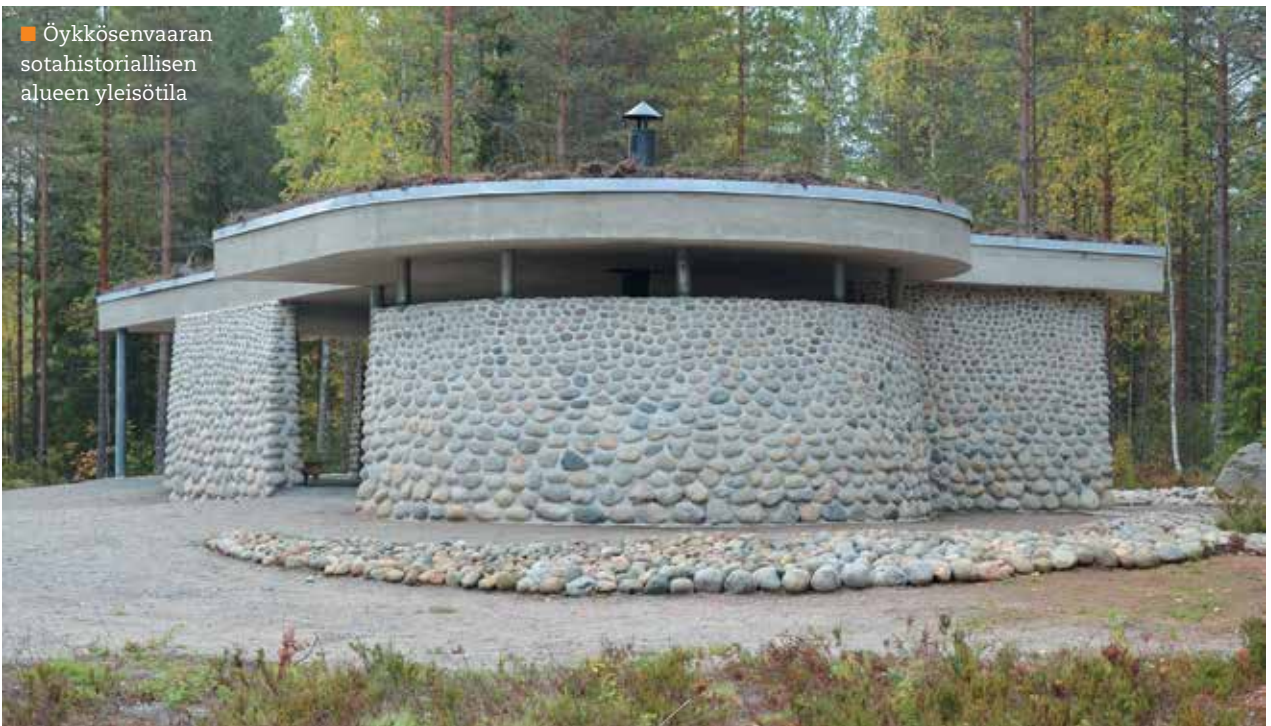
■ Öykkösenvaaran sotahistoriallisen alueen yleisötila

kunta, Museoviraston rahoituksella Ilomantsi-Seura ry, 21.Prikaatin Perinneyhdistys ry sekä yksityiset lahjoittajat. Kevään ja kesän jatkuneet työt valmistuivat Ilomantsin taisteluiden päättymisen 70-vuotisjuhliin mennessä 9. elokuuta 2014 ja kaikkiaan vapaaehtoisiin osallistui yhteensä 21 yhdistystä tai yhteisöä. Pääasiasa urakkaan osallistui Pohjois-Karjalan reserviläisiä, mutta mukana olivat vahvasti myös lähialueen Lions-klubit sekä perinneyhdistykset, erityisesti 21.Prikaatin Perinneyhdistys ry jonka jäseniä osallistui töihin eri puolilta