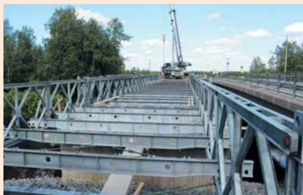
■ Varasiltakalustosta kootut siltalohkot paikoillaan Limingassa Temmes-joen yli