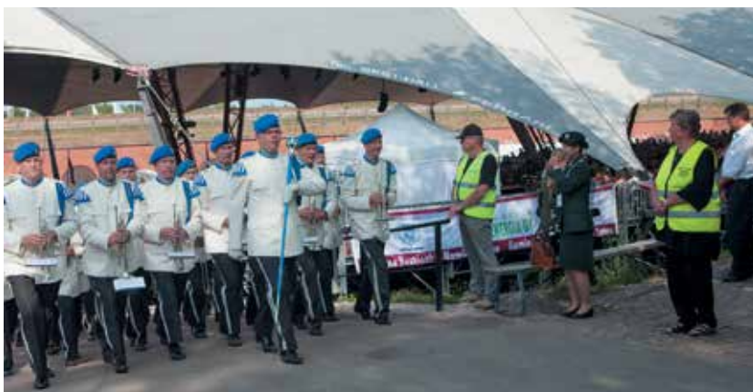
■ Järjestyksenvalvojat Bastionissa.

Tehtävästä riippuen talkoilusta saa siis palkakseen hienon kokemuksen marssi-show'n hymyilevistä yleisöjoukoista tai karumman tuntikausien rupeaman pölyisellä hiekkakentällä yksinäistä bussia vartioiden... Mutta näilläkin näkymin kilta on valmiina palvelukseen myös Hamina Tattoossa 2016!