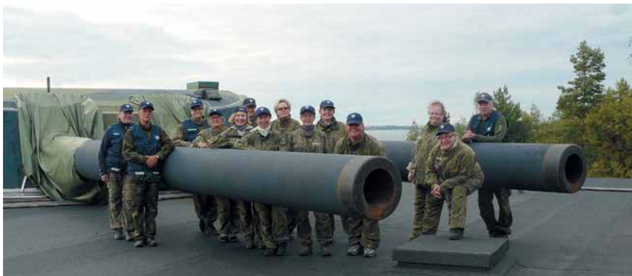
■ Kurssilaiset tutustumassa Vanhaan Rouvaan