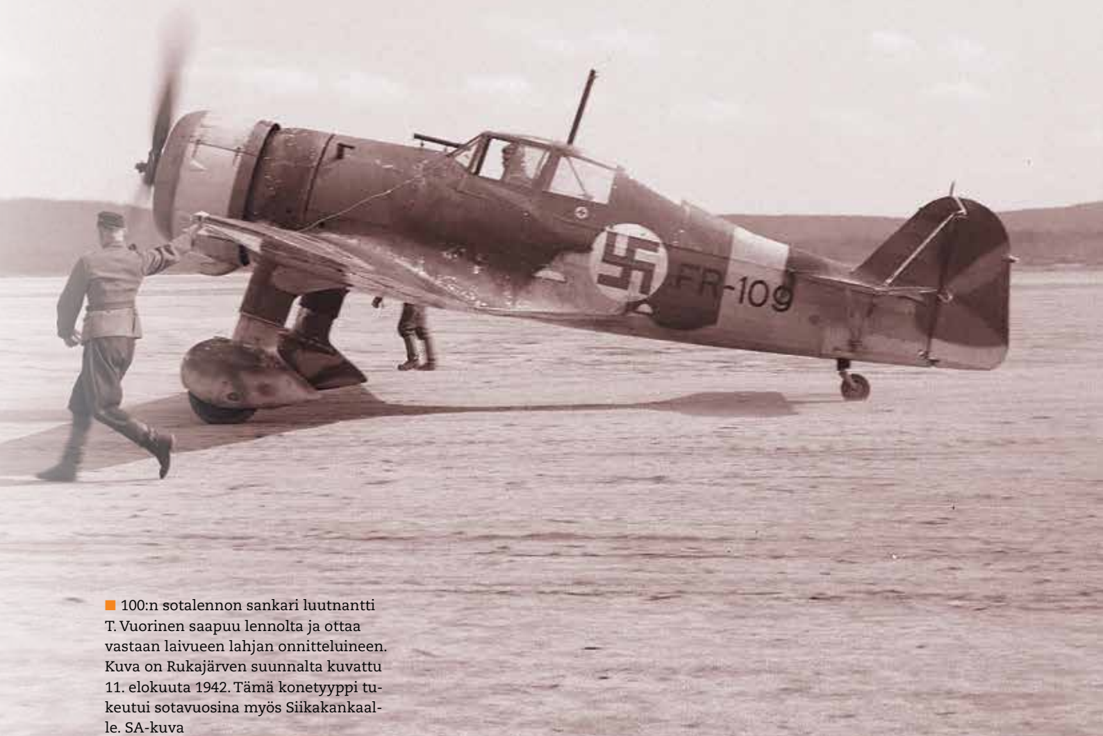
■ 100:n sotalennon sankari luutnantti T. Vuorinen saapuu lennolta ja ottaa vastaan laivueen lahjan onnitteluiheen. Kuva on Rukajärven suunnalta kuvattu 11. elokuuta 1942. Tämä konetyyppi tukeutui sotavuosina myös Siikakankaalle.