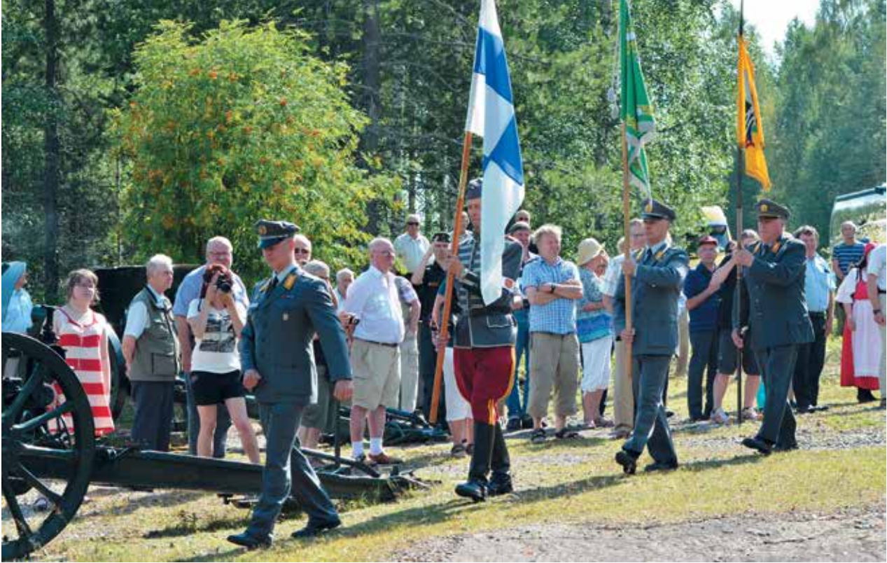
■ Hämeen Ratsujääkäripataljoonan ja Ratsumieskillan liput saapuvat Palovaaran muistomerkkialueelle siniristilipun vana-vedessä.

I lomantsiin oli heinäkuussa siirretty Viipurinlahden torjuntataistelujen hiljennyttyä myös Ratsuväkiprikaati kaksine ratsurykmentteineen (HRR ja URR). Näistä Hämeen ratsumiehet kunnostautuivat erityisesti Hattuvaaran suunnalla.