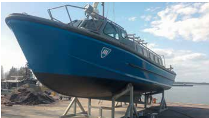
■ Killan uusi M/S Kuivasaari sai MPK:n värit ja logot

Rannikkotyökistön siirtyessä pikkuhiljaa aselajina historiaan, on meidänkin killan pakko kääntää katsemme mantereelle ja rannikkojoukkoihin. Varusmiehet ovat linnakkeilta hävinneet ja siirtyneet rannikon kasarmeihin. Toki killan merkitys historiallisten ja kulttuurillisten arvojen vaalijana jatkuu, mutta nuorta verta on saatava ”ukkoutuvan ja akkautuvan” killan toimintaan mukaan. Uutta toimintaa siis on kehitettävä. Mitä se on, aika näyttää.