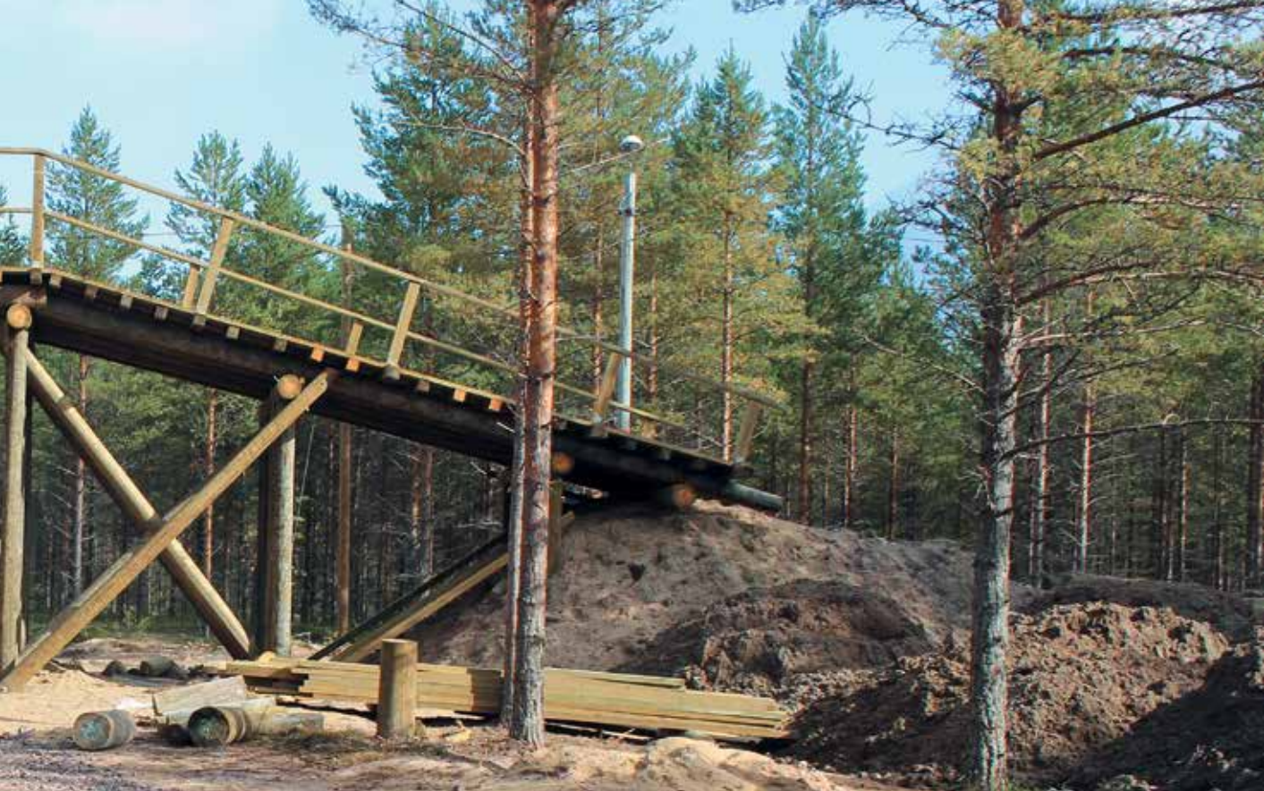
■ Lumijoen Ukuranperän hiihtostadionin latusilta pientä viimeistelyä vaille valmis ja odottamassa ensilunta sekä hiihtäjiä