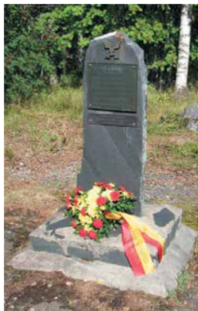
■ Hattuvaaran taisteluiden muistoa kunnioittaen Hämeen ratsumiehet.

Ratsumiehiä ja naisia oli matkassa bussilastillisen verran ja omaa reittiään matkasi myös ratsuosasto. Yhdeksän ratsukon osasto esiintyi lauantaina juhlakentällä ylittäen huomioarvollaan eli suosiollaan sekä Hornetin että NH-helikopterin. Ratsuväen sulkeisjärjestystä 1930-luvun malliin esittivät Hämeen ja Lahden eskadroonien perinneasuihin pukeutuneet ratsukot. Ilomantsin reissun yhteydessä