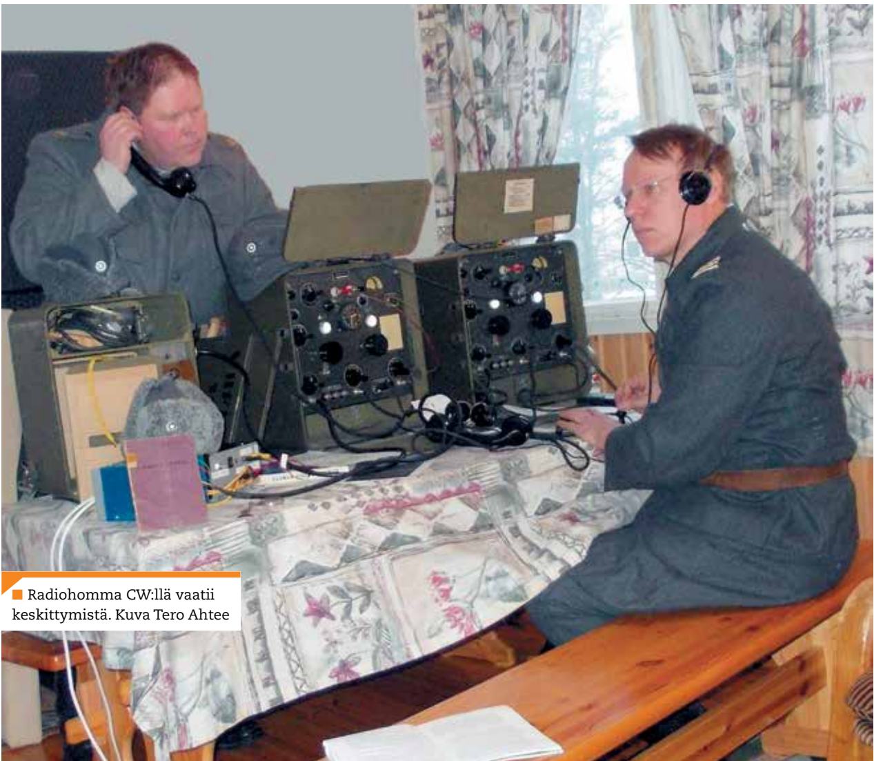
■ Radiohomma CW:llä vaatii keskittymistä.