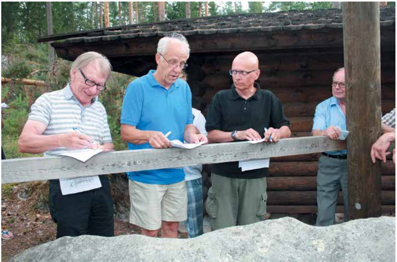
■ Herrashenkilökisailijoita arvuuttelemassa tunnistorastin esineitä.

■ TEKSTI: CARL-MAGNUS GRIPENWALDT