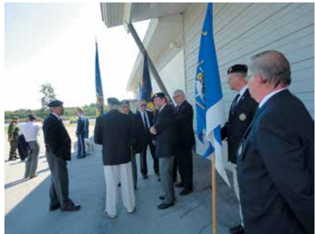
■ Valmistautumista paraatiin.

Sunnuntaina aamupäivällä sattui myös erikoinen tapahtuma. Epäiltiin, että joku henkilö oli hukkunut Kaupunginlahdella, koska rannalta oli löydetty vaatemytty ilman omistajaa. Länsi-Suomen merivartioston helikopteri oli tullut Turusta asti etsintöihin, joihin myös killan vene Maria osallistui. Onneksi hälytys oli väärä, koska vaatemytyn omistaja ilmoittautui myöhemmin itse poliisille.