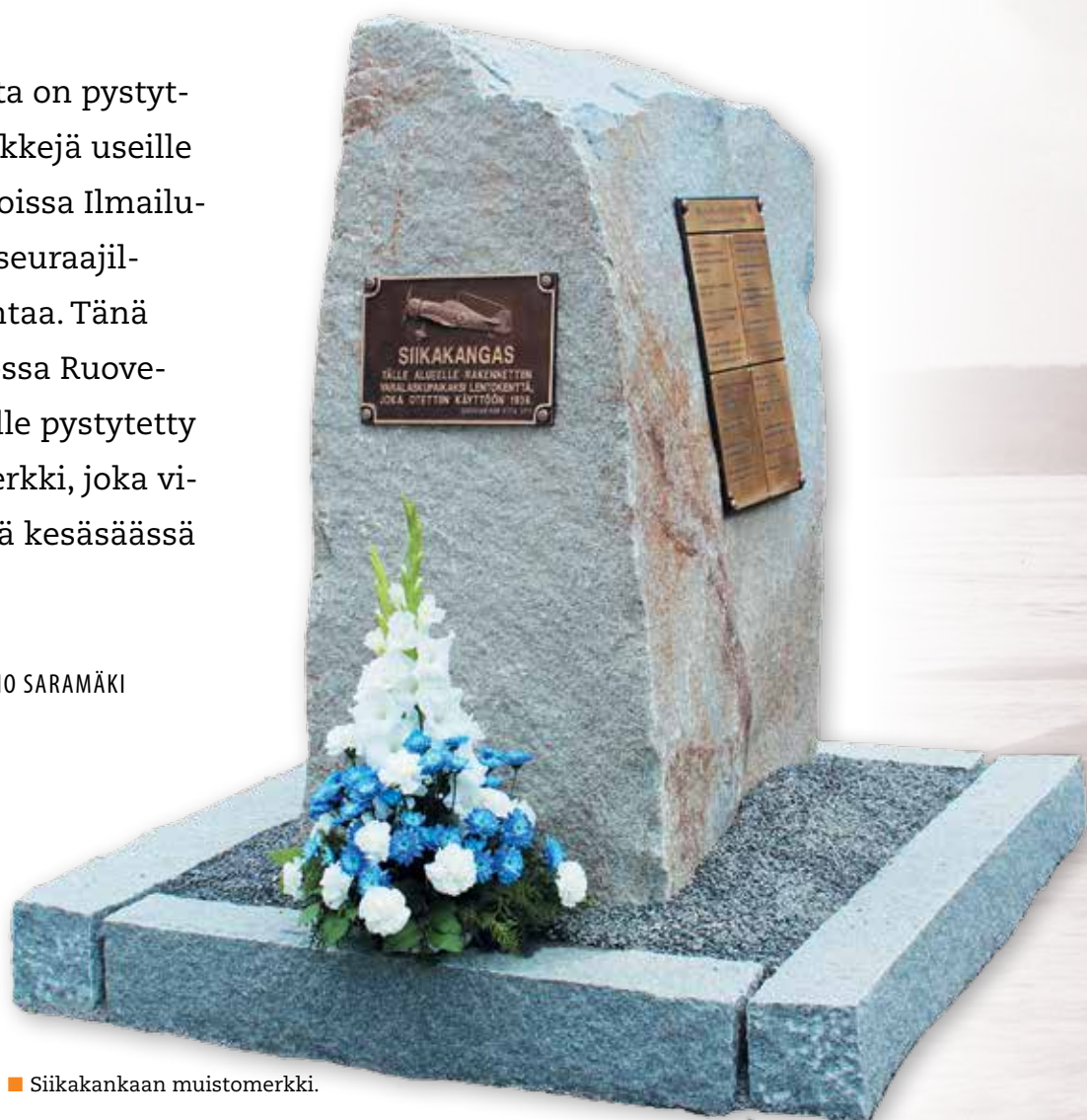
■ Siikakankaan muistomerkki.