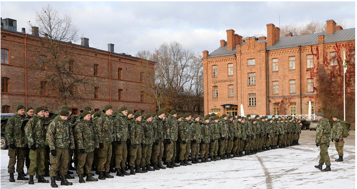
Riihimäen Viestirykmentin varusmiehet tutustuivat museoon 22. lokakuuta.

Kuvassa vasemmalta: viestitonttu Seppo, pioneeritonttu Jaakko ja tykistötonttu Vilho vierellään morsiamensa Linnea.